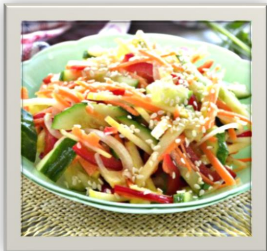
Рецепт: овощной салат с кунжутом по-корейски Телеграм